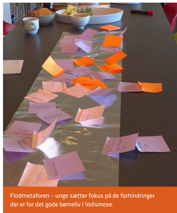
Flodmetaforen – unge sætter fokus på de forhindringer der er for det gode børneliv i Vollsmose.

desuden den funktion, at deltagerne lærer hinanden bedre at kende, der skabes en tryghed og tillid og dermed forhåbentlig en stemning, som fremmer de kreative processer og samtidig gør deltagerne i godt humør.