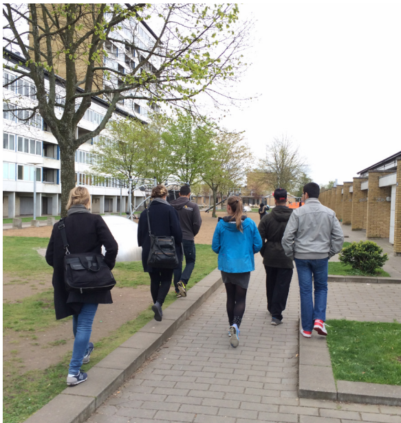
Børnerådet på guidet rundtur i Vollsmose.