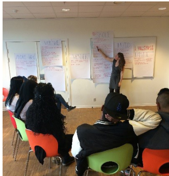
Deltagernes input ved kritikfasen gennemgås.