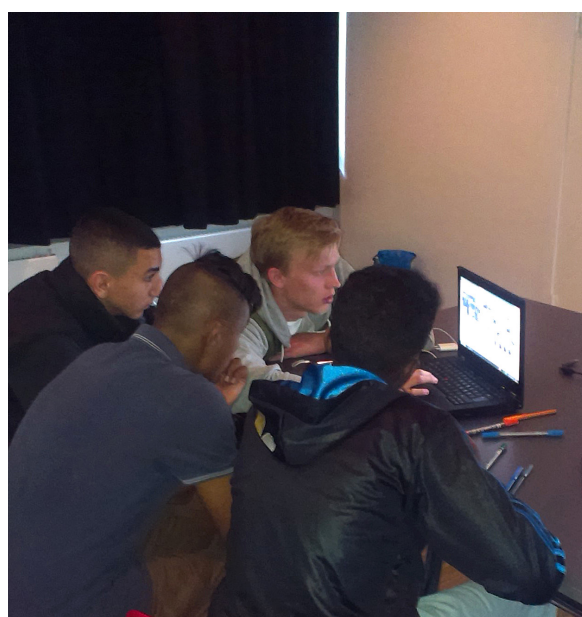
En gruppe drenge arbejder med at visualisere deres drøm gennem en videoproduktion.

kritikpunkter, de finder vigtigst. På baggrund heraf tematiseres kritikpunkterne.