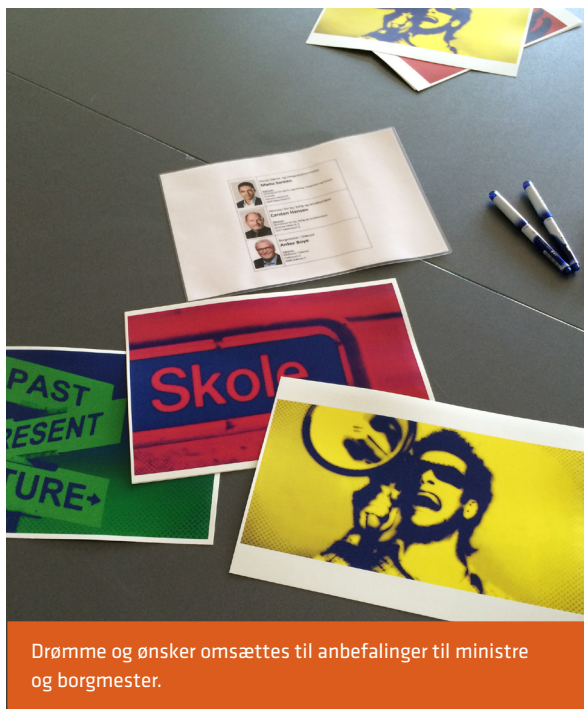
Drømme og ønsker omsættes til anbefalinger til ministre og borgmester.