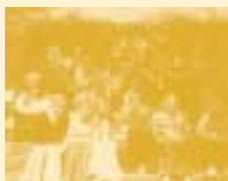
6a, Bakkeskolen, Hørning

I foråret 2002 besøgte Børnerådets formand fire af panelklasserne i Børnerådets Børnepanel, nemlig klasserne på Fredensborg Byskole i Hillerød, på Bakkeskolen i Hørning, på Kastrup Centralskole i Vordingborg og på Borgerskolen i Assens. Formålet med besøgene var at komme i direkte dialog med børnene - noget den almindelige spørgeskema-form fra panelundersøgelserne ikke tillader.