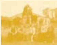
6a, Kastrup Centralskole, Vordingborg

Det kan vi li' – det vil vi have mere af, det kan vi ikke li' – væk med det. Sådan lød indgangsvinklen for de samtaler Børnerådets formand havde med børn fra Børnepanelet, da han i foråret 2002 besøgte fire af klasserne.