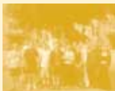
6a, Borgerskolen, Assens

Det kan vi li' – det vil vi have mere af, det kan vi ikke li' – væk med det. Sådan lød indgangsvinklen for de samtaler Børnerådets formand havde med børn fra Børnepanelet, da han i foråret 2002 besøgte fire af klasserne.