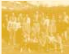
6a, Fr.borg Byskole, Hillerød